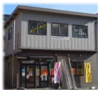
スーパーイオン様並び、 ラーメン 55 様の 2F