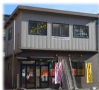
スーパーイオン様並び、 ラーメン 55 様の 2F